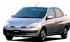
ハイブリッドカー第1号 トヨタ自動車の初代プリウス(1997年)

1997年にトヨタ自動車が初代プリウスを発売。世界初の量産型ハイブリッドカーです。「21世紀に間に合いました」というキャッチコピーで発売された当時の燃費は28km/l、そして現在は更に改良され、